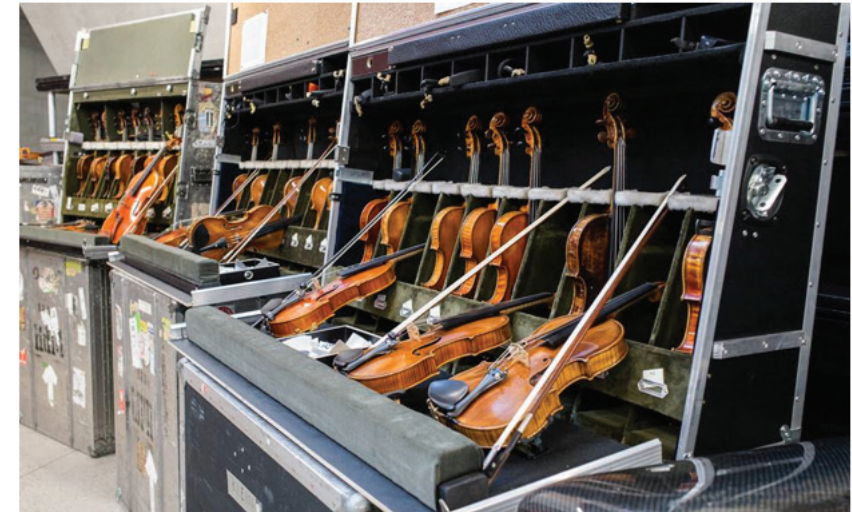
1. ábra: Bécsi Filharmonikusok hegedűinek csoportos szállítása